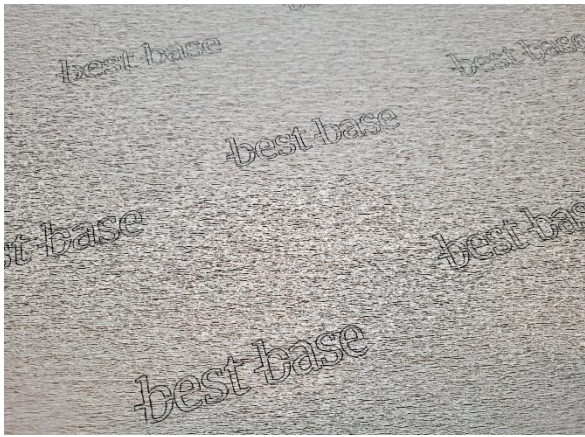
Figure 1: Picture of the received sample (surface)